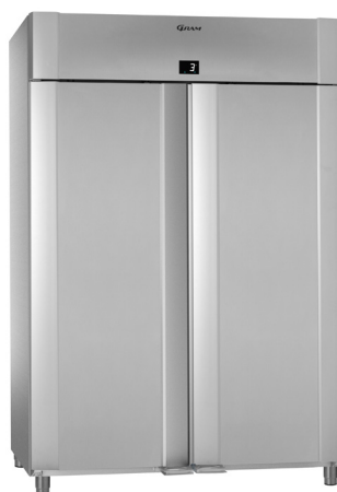
ECO PLUS 140 Vario silver