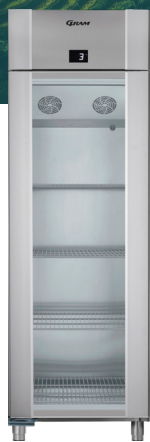
ECO PLUS 70 Vario silver