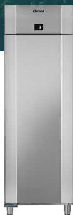
ECO PLUS 70 Roestvrij staal