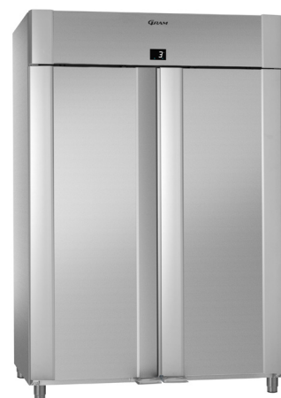
ECO PLUS 140 Roestvrij staal